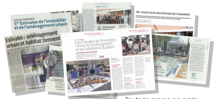
Toute la presse en parle...

Les Nouvelles Publications (professions libérales, entrepreneurs, PME PMI) et TPBM-Provence (BTP, immobilier, bureaux d'études, architectes), le magazine d'art de vivre « EXPOSUD » ainsi que le magazine immobilier d'annonces Surface Privée , (éditions Pays d'Aix-Alpes, Provence, Vaucluse et Marseille)